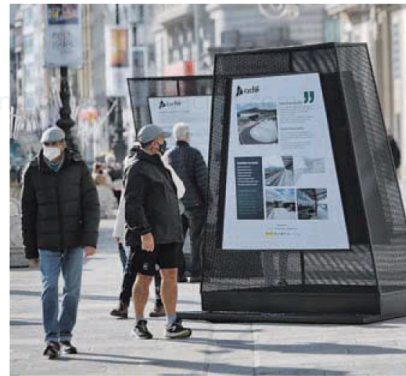
La exposición exterior del Cantón Grande, en A Coruña. MARCOS MIGUEZ

La exposición hace un repaso histórico a las conexiones ferroviarias entre Madrid y Galicia, detalla las principales magnitudes del nuevo acceso de alta velocidad, describe el trazado y ordena cronológicamente los hitos de su ejecución y puesta en servicio, además de recoger la aportación de fondos europeos a su desarrollo. También hay espacios donde se explican las medidas tomadas durante las obras para la protección del entorno medioambiental y del patrimonio cultural.